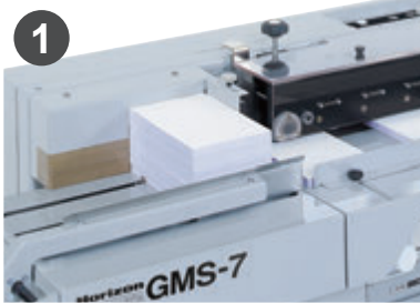
帳票を積みスタート。

厚さ5～15 mmの帳票は自動供給されます。追積みが可能のため、ノンストップで処理できます。手動供給時は、厚さ2～30 mmまで対応可能です。