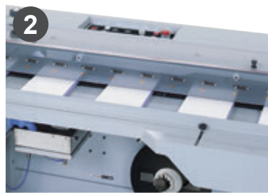
テープを貼ります。