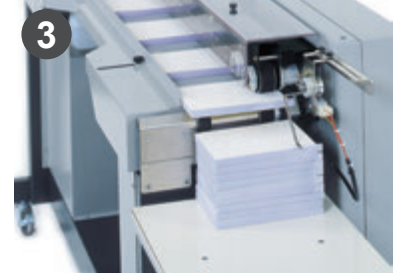
完成品はスタッカーに積み上げられます。