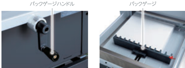
※カバーを取り外して撮影しています。

断裁幅は最大390 mm、厚さは最大50 mmまで断裁が可能です。0.5 mm単位で調整可能なバックゲージは、ハンドルを回すことで簡単かつ正確に断裁寸法を調整できます。用紙の固定は万力締め方式のため、ぶれの少ない高精度な断裁が可能です。