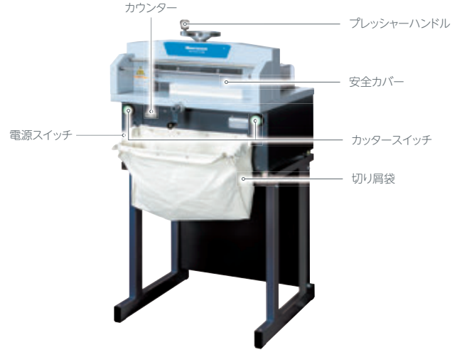
写真はオプションの専用台 MT-39II 付きです。