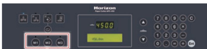
ファンクションキー

頻繁に行う断裁プログラムを3つまで登録することができます。ファンクションキーを押すことで登録された断裁作業のジョブ設定を瞬時に呼び出すことができ、作業の効率化に貢献します。