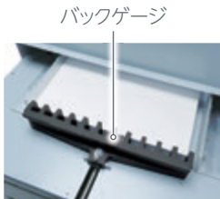
※実際はカバーで覆われている部分の写真です。

バックゲージの用紙当ての突起を細かく配置すると、名刺などの小サイズの用紙も断裁できます。バックゲージは0.1 mm単位で微調整が可能です。また、自動突出し機能を搭載しており、断裁後の用紙の取出しがスムーズかつ安全に行えます。