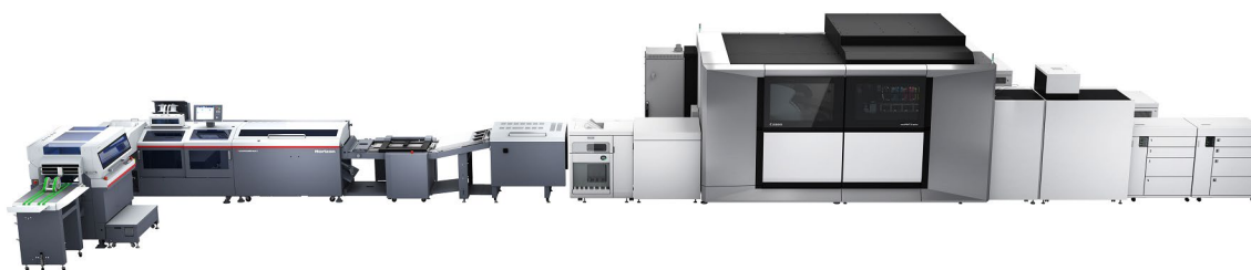
varioPRINT iX3200・iCE STITCHLINER Mark V インライン接続イメージ

株式会社ホリゾンは、本社びわこ工場内 Horizon Innovation Park において、キヤノン株式会社の A3 ノビサイズ対応の商業印刷向け枚葉インクジェット印刷機「varioPRINT iX3200」と、ホリゾンのデジタル印刷向け中綴じシステム「iCE STITCHLINER Mark V」をインラインで接続した構成を、4月9日より日本国内で初めて展示します。本展示では、印刷から中綴じ製本までを一気通貫で自動化することで、商業印刷をはじめとする多様な印刷現場が直面する省人化と高生産性の両立という課題に対し、実践的かつ即戦力となるソリューションを提案します。