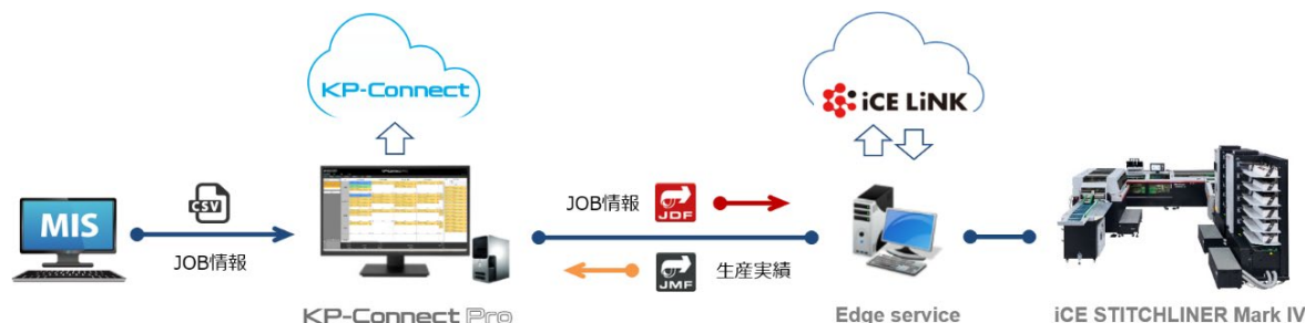
株式会社セントラルプロフィックス様 自動化ワークフロー概略図

国内外において双方のワークフロー連携による運用開始は初めての事例であり、今回の導入事例をもとに印刷業界における DX、ワークフローの自動化をより一層推進してまいります。