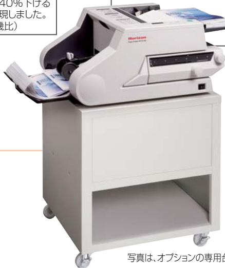
写真は、オプションの専用台MT-330付です。