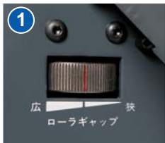
● ローラギャップ調整