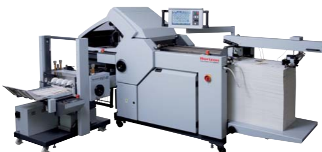
※写真の横型プレススタッカーPST-40は、オプションです。

大型カラータッチパネルディスプレイに折り形と用紙サイズを入力するだけで、17タイプの折りを自動セットします。世界初の調整ダイヤル付き赤外線通信コントローラ(ワイヤレスリモコン)を標準装備しています。