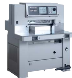
安全装置型式検定合格商品

高剛性鋼鉄フレーム構造の採用と、最高40回/分で高速駆動する刃物により、美しい断裁仕上りを可能にします。