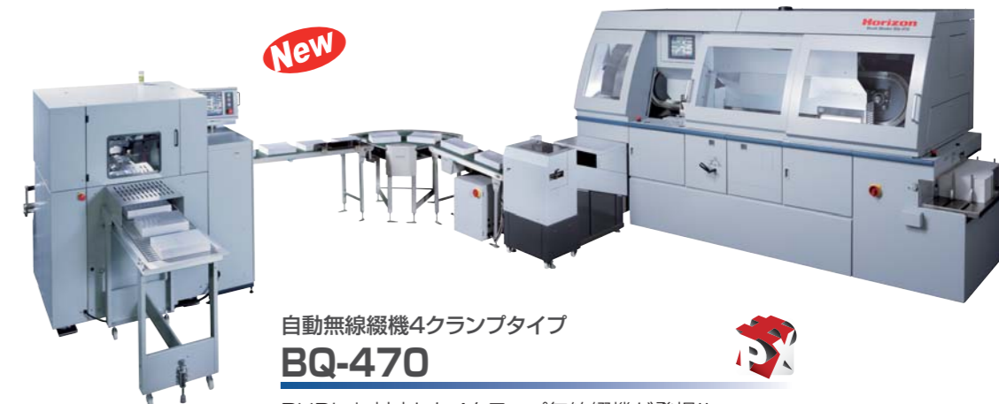
HT-80とBQ-470の実演は単体仕様です。

断裁前寸法と断裁後寸法を入力するだけで、各部調整を自動で行います。BQ-470と連結すれば、製本仕上げ断裁までインライン処理が可能です。